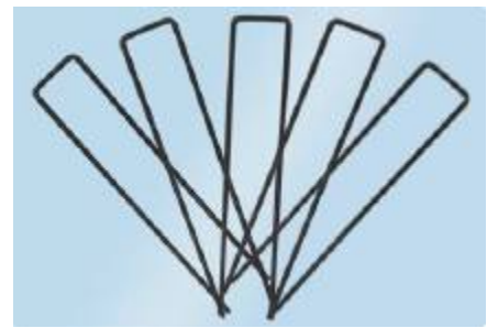
Uñas en forma de U